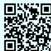
紫竹林精舍106年度 健康系列講座

TEL: (07) 7133891～3 0963-506891 FAX: (07) 7254950