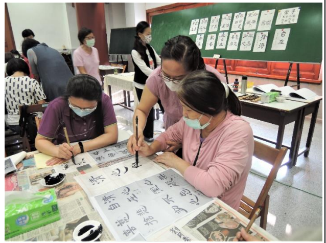
照片說明：學員認真練習