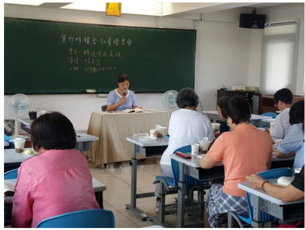
照片說明：20160721 知賓讀書會(美容導讀)