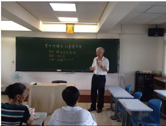
照片說明：20160721 知賓讀書會(志工分享)