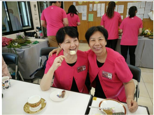
照片說明：2016911「待客之道」研習